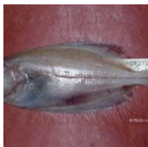
Lepidorhombus whiffiagonis Areiro